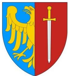
Prezydent Miasta Żory