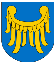
Starosta Powiatu Rybnickiego