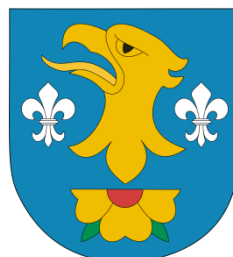
Starosta Powiatu Wodzisławskiego